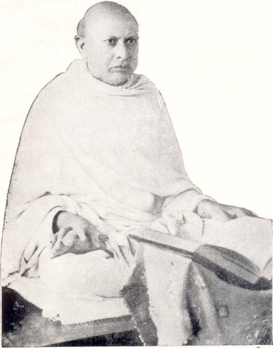
परमोपकारी पूज्य गुरुदेव श्री कानछरवाभी